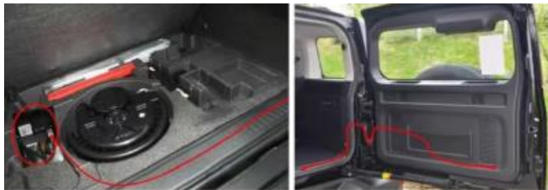
Схема протяжки жгута проводов