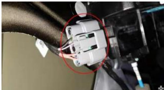
После подключения штатного разъема центрального замка и переходника доводчика протестируйте работу доводчика