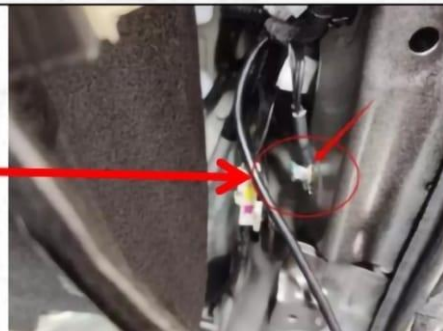
Подключение массы производится за правой панелью на штатный винт массы как на фото